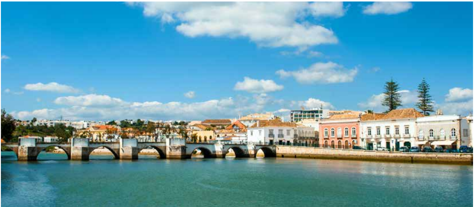
Rio Gilão / Rivière Gilão / Gilão River

Much more than dream beaches, Tavira is also a historic city consecrated by UNESCO and full of architectural and cultural treasures, such as its medieval castle offering a magnificent view of the city, the church of Santa Maria, the municipal market, the Roman bridge and many others. You can lose yourself in the cobbled streets of the city center and discover the authentic Portuguese atmosphere, with its typical restaurants, cafes and stores.