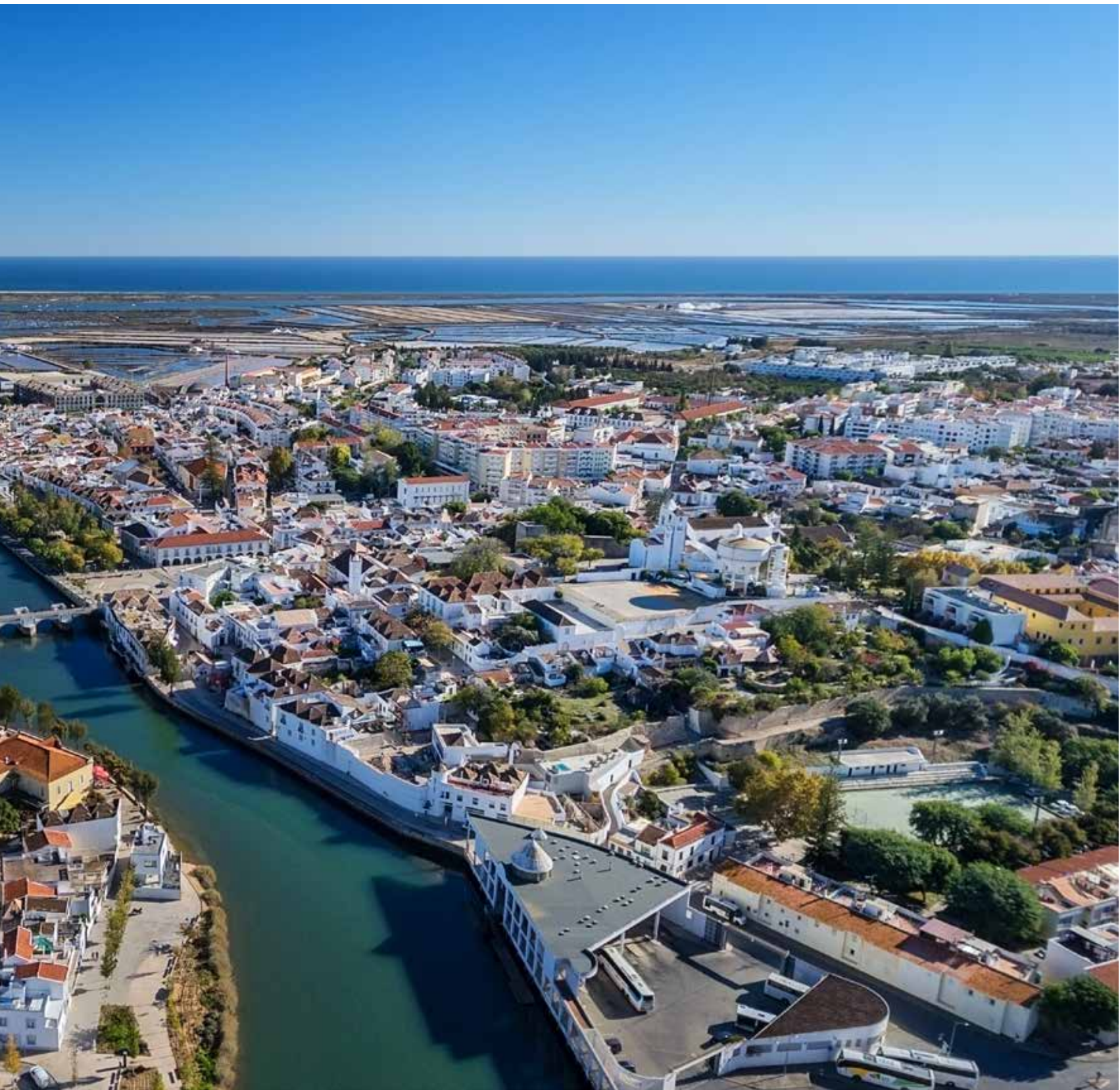
Paisagem aérea da Tavira / Vue aérienne de Tavira / Aerial cityscape of Tavira