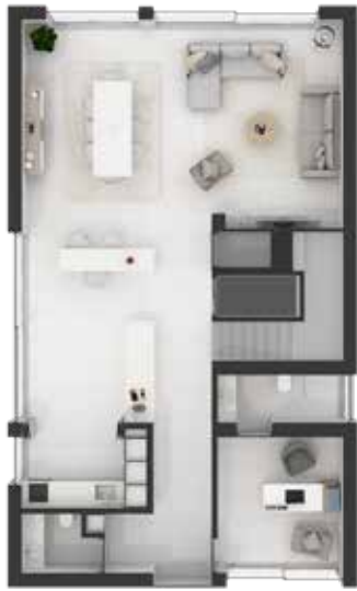
Térreo / Rez-de-chaussée / Grounfloor