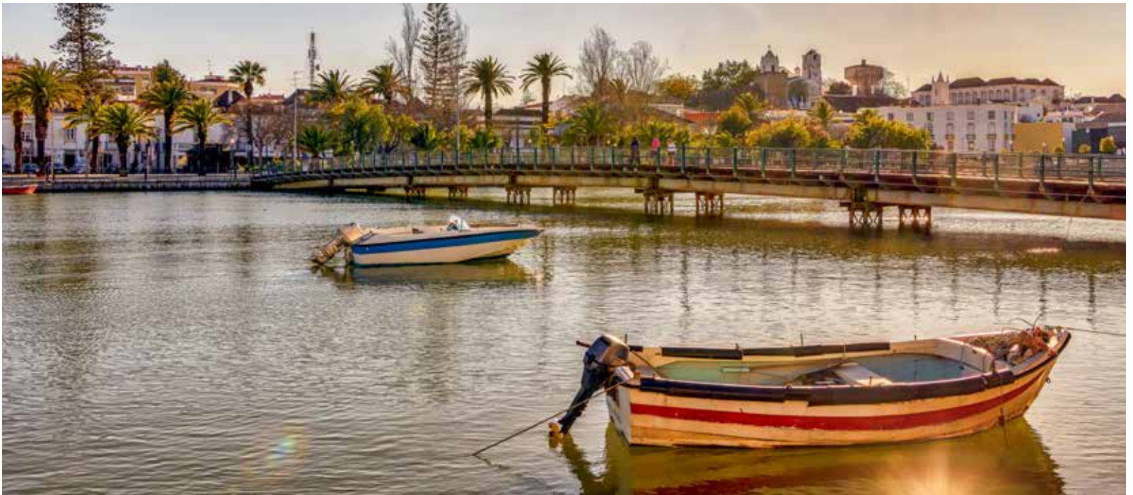
Rio Gilão / Rivière Gilão / Gilão River