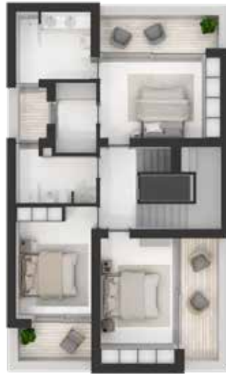
Primeiro andar / Premier étage / First floor