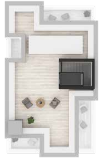
Terraço / Terrasse / Terrace