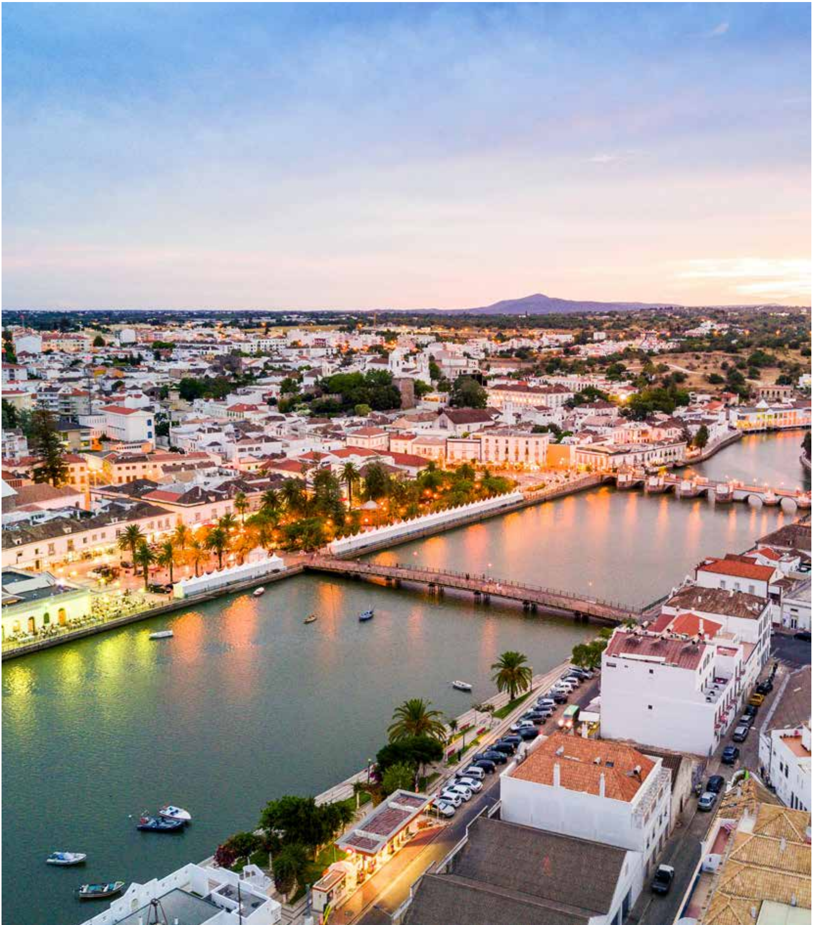
Vista aérea Rio Gilão / Vue aérienne Rivière Gilão / Aerial view Gilão River